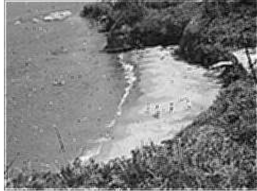
(b) Figure 12