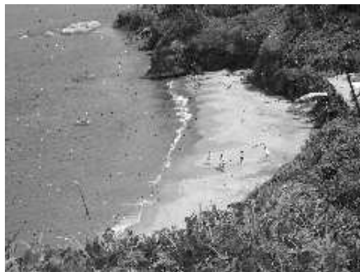
(b) Figure 2