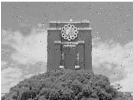
(a) Figure 1